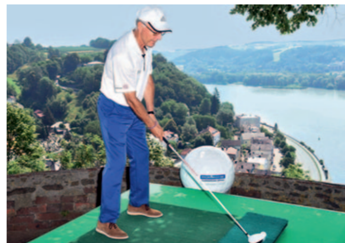
Der Kaiser mit dem Driver: Franz Beckenbauer beim Abschlag in Passau Richtung Drei-Flüsse-Eck.

■ Tickets für die Porsche European Open unter www.europeanopen.com